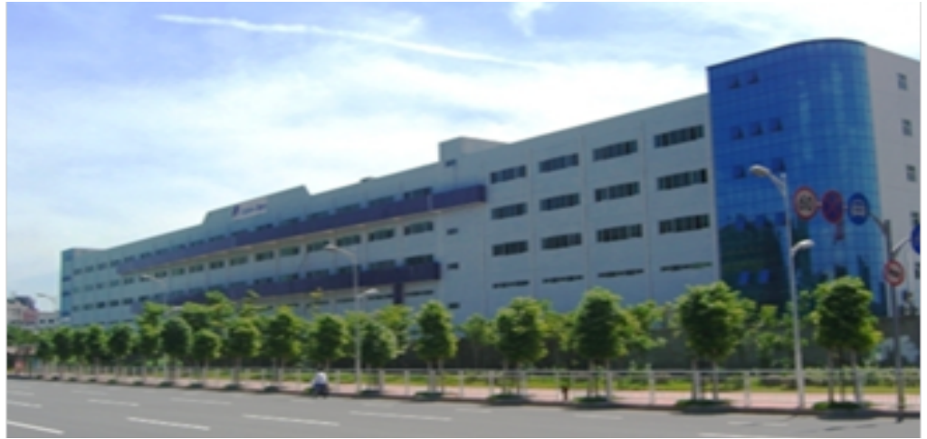
中日龙电器制品（深圳）有限公司外景

中日龙电器制品（深圳）有限公司成立于1990年，是隶属于中日龙电器股份（香港）有限公司的一家大型日资企业（被宝安区列为知名企业），厂址位于深圳市宝安区沙井镇，目前拥有占地面积100000平方米，建筑面积80000平方米的厂房。已通过ISO9001（2000版）及ISO14001认证，并取得SONY绿色采购伙伴认证。现有职员4200人，主要客户有东芝、松下、富士通、亚洲兄弟公司、NEC、三洋、京瓷等等，目前主要生产笔记本电脑、数码相机、投影仪、手机、汽车部件、小家电外壳等。